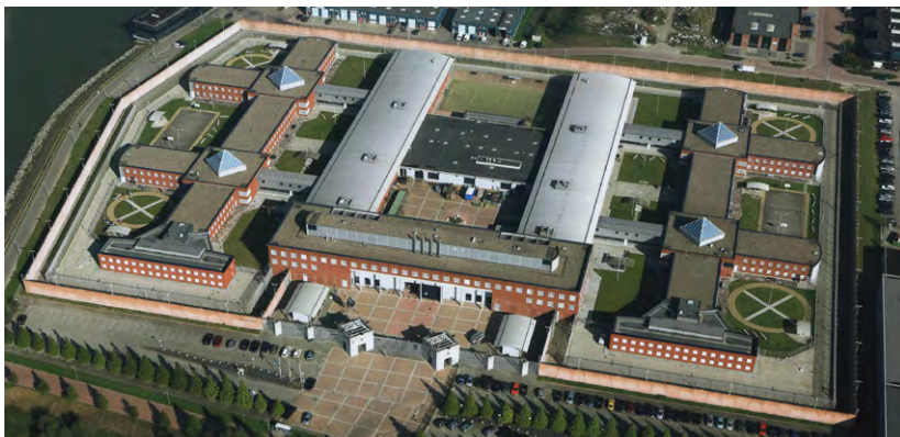
↑ poortgebouwen "de Wachters" ← situatie

Het plein met deze symbolische poorten vormt de overgang van buiten naar binnen. Overdag is het voorplein niet afgesloten. Een kunstwerk draagt bij aan het karakter van het plein. Om de totale realisatietijd tot een minimum te beperken is gekozen voor een hoge mate van prefabricage, waarvan de productie tijdens benodigde proceduretijd werd uitgevoerd.